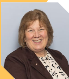
13 Claire Dizes Village