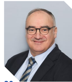
30 Arnold Cara Village