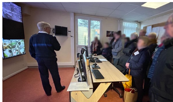
centre de supervision urbain