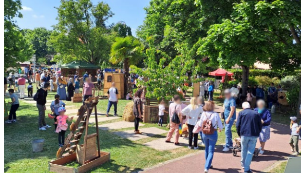
Quartiers en fête