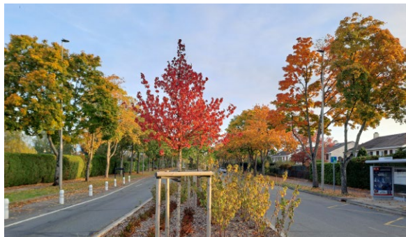
Avenue Nicolas About