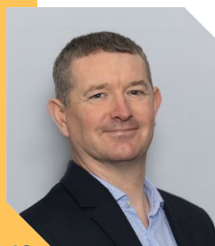
18 Julien Le Coquil Plan de l'Église